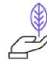
Valeurs Écologique et Responsable

Nous proposons un espace éphémère de qualité, qui permet au public de développer des connaissances musicales et artistiques dans un univers à part. C'est également un lieu dans lequel le public est libre de s'exprimer, d'échanger et de créer grâce aux activités proposées.