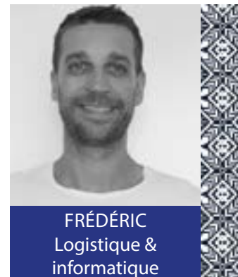
FRÉDÉRIC Logistique & informatique