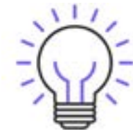
Valeurs Cognitive et Émotionnelle

Nous nous engageons dans une démarche éthique, respectueuse de l'environnement et favorisons des méthodes de productions responsables. Nous favorisons les producteurs locaux, inscrits dans une démarche éco-responsable. Des actions concrètes de sensibilisation vers le public sont mises en place dans toute la chaîne de l'organisation de l'événement.