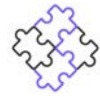
Valeurs Artistique et Esthétique

Nous créons avant tout un espace de rencontre ouvert à toutes et tous où se mêlent convivialité et culture. Un lieu dans lequel les gens se rassemblent, partagent, et sont invités à découvrir les artisans, brasseurs et vigneron locaux, autour d'un plaisir commun : la musique.